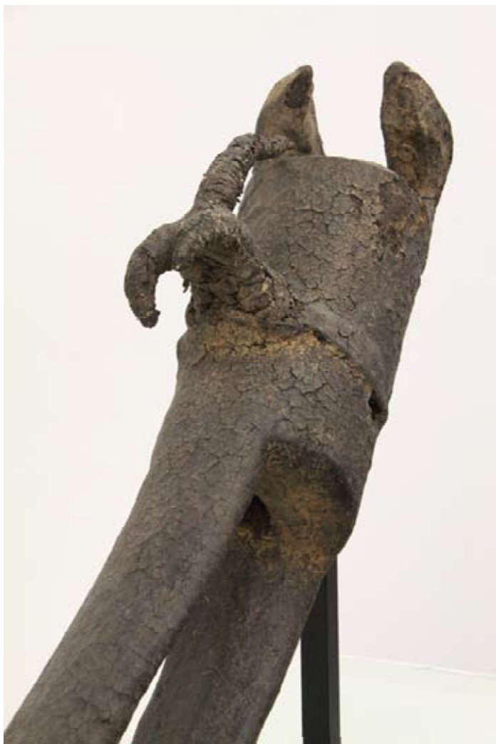
Boli évoquant un masque du Komo XXème siècle, Région de Ségou, Pays Bamana - Mali. Dimensions sur socle : 68 x 73 x 20 cm