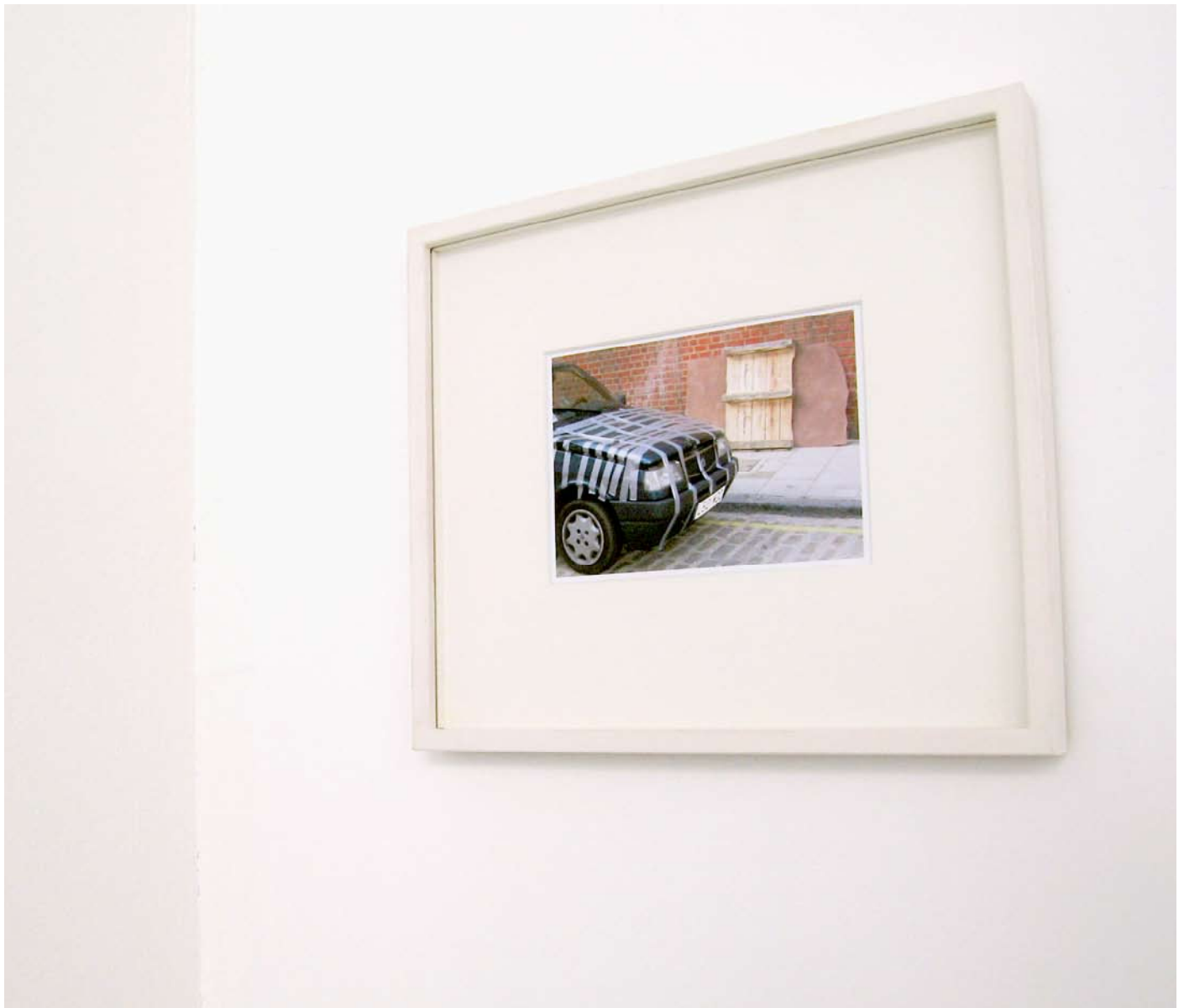
Charles Mason Untitled, 2004 Tirage numérique. 11 x 15 cm