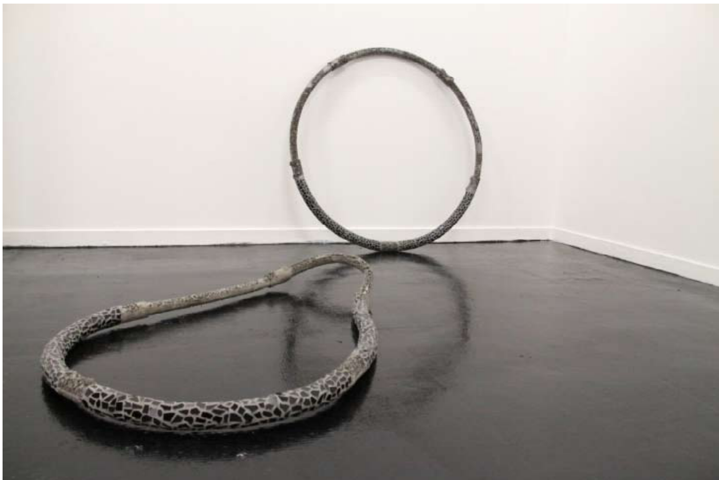
Charles Mason Hoops 2008 Béton, acier, céramique. Hauteur :120 cm, autres dimensions variables