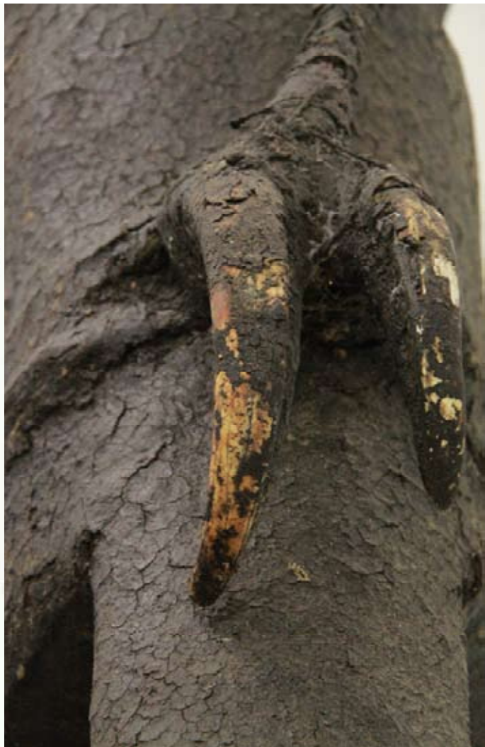
Boli évoquant un masque du Komo XXème siècle, Région de Ségou, Pays Bamana - Mali. Dimensions sur socle : 68 x 73 x 20 cm