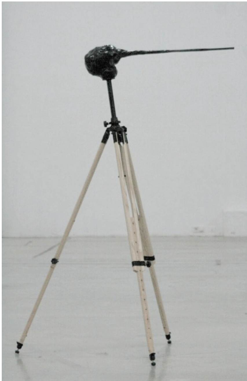
Benoît Maire Le nez 2010 Métal, bois, bronze Dimensions variables