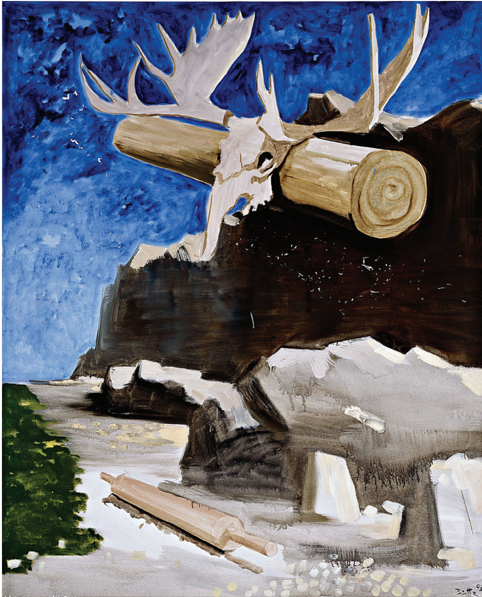
Werner Büttner Küste mit angeschwemmten Nudelholz 2005 Peinture acrylique sur toile 150 x 120 cm