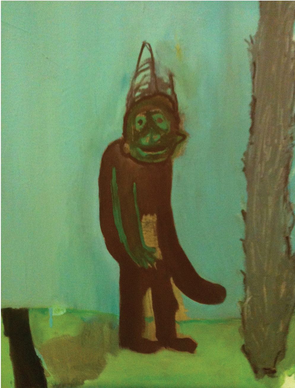
Vincent Gicquel Totem 2011 Peinture à l'huile sur toile 46 x 38 cm