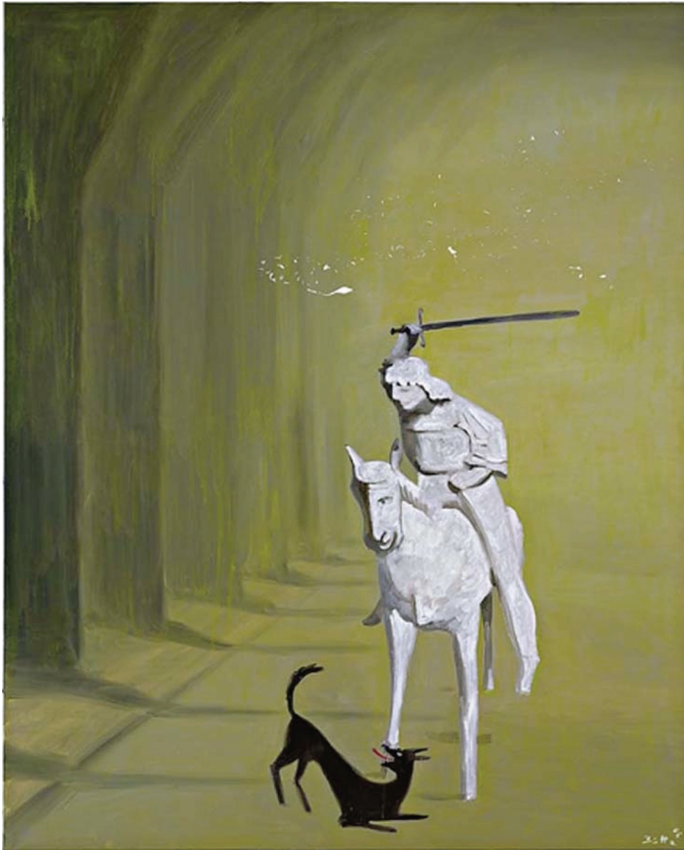
Werner Büttner Erregung im Nebel 2005 Peinture acrylique sur toile 150 x 120 cm