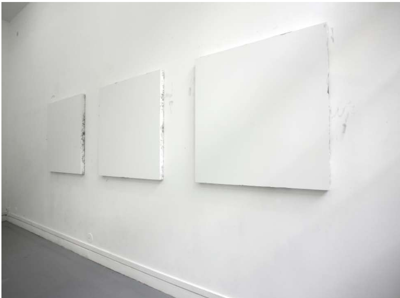
Masahide Otani Untitled 2008 painting