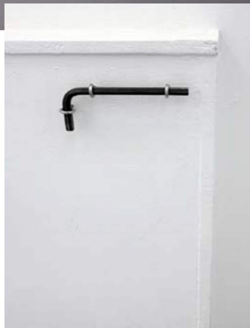
Charles Mason Picnic Table (detail) 2008 80 x 168 x 143 cm Steel scaffold