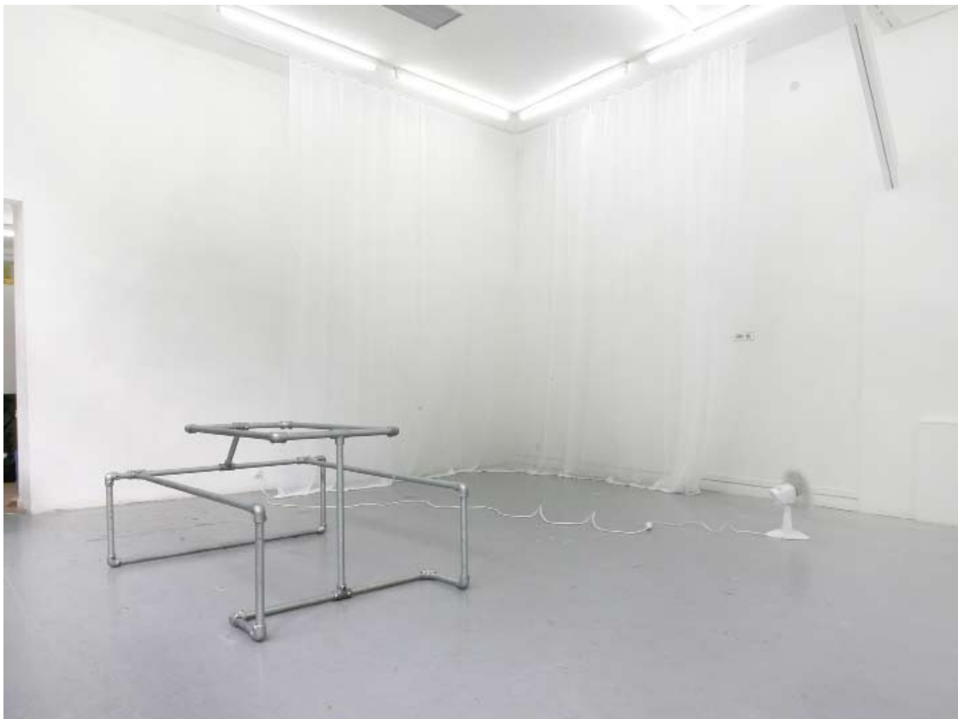
From the left to the right

Charles Mason Picnic Table 2008 80 x 168 x 143 cm Steel scaffold