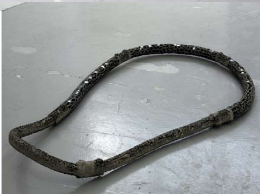
Charles Mason Circle loop 2007 Marble mosaic, concrete, porcelain floor tiles