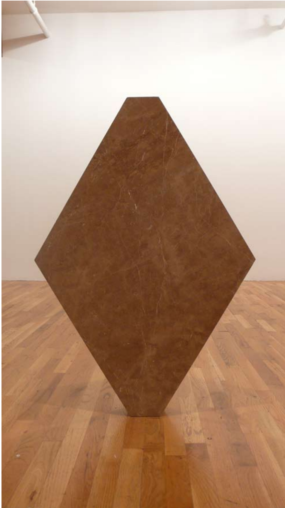
Placemark (Emperador) 2008 marble, steel, 100 x 70 x 10 cm