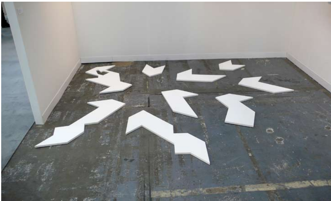
NY, NY (after Herb Lubalin) 2008 MDF, wall paint, 9 elements, variable dimension