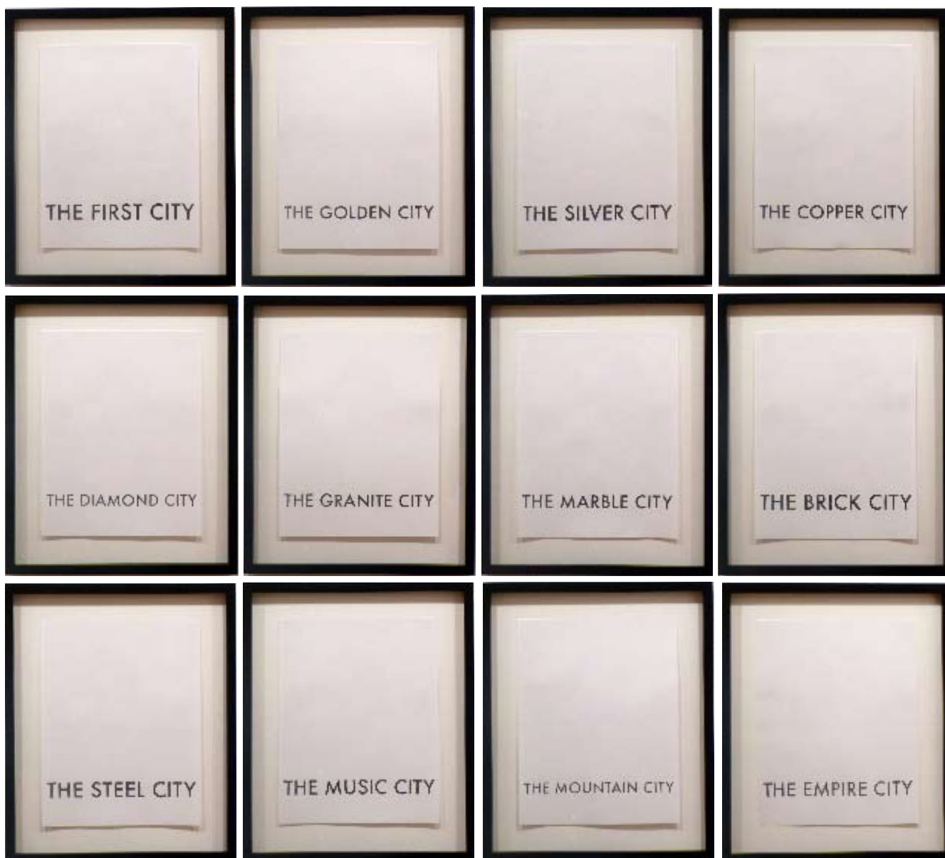
Cities 2008 pencil on paper, series of 12 drawings 27,9 x 21,6 cm each