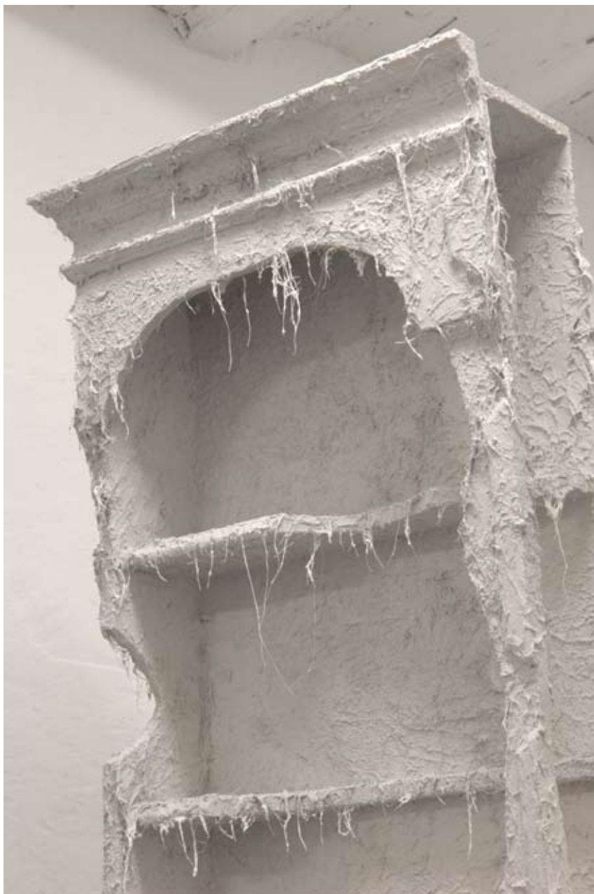
Break my body, hold my bones 2009 detail