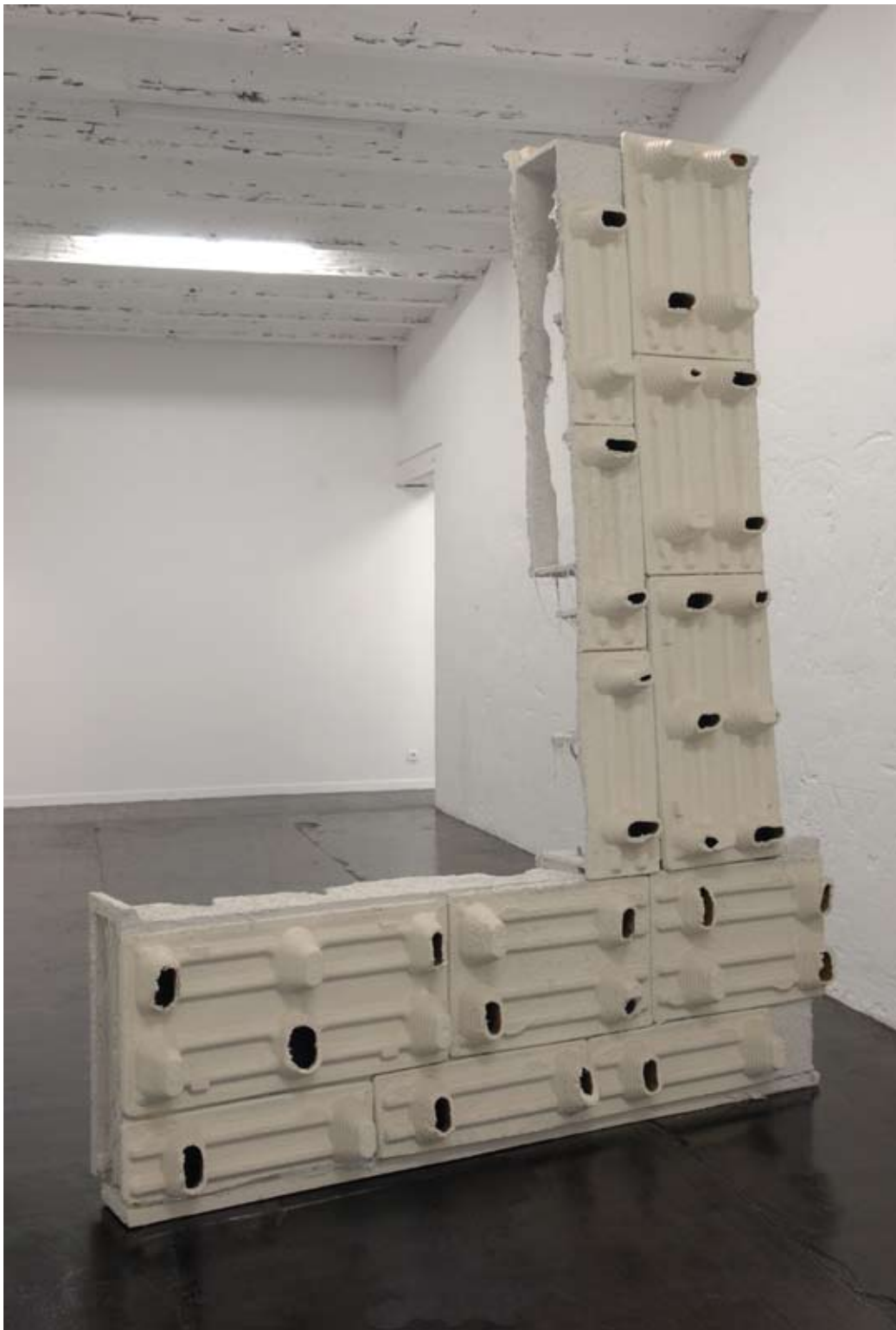
Break my body, hold my bones 2009 Back