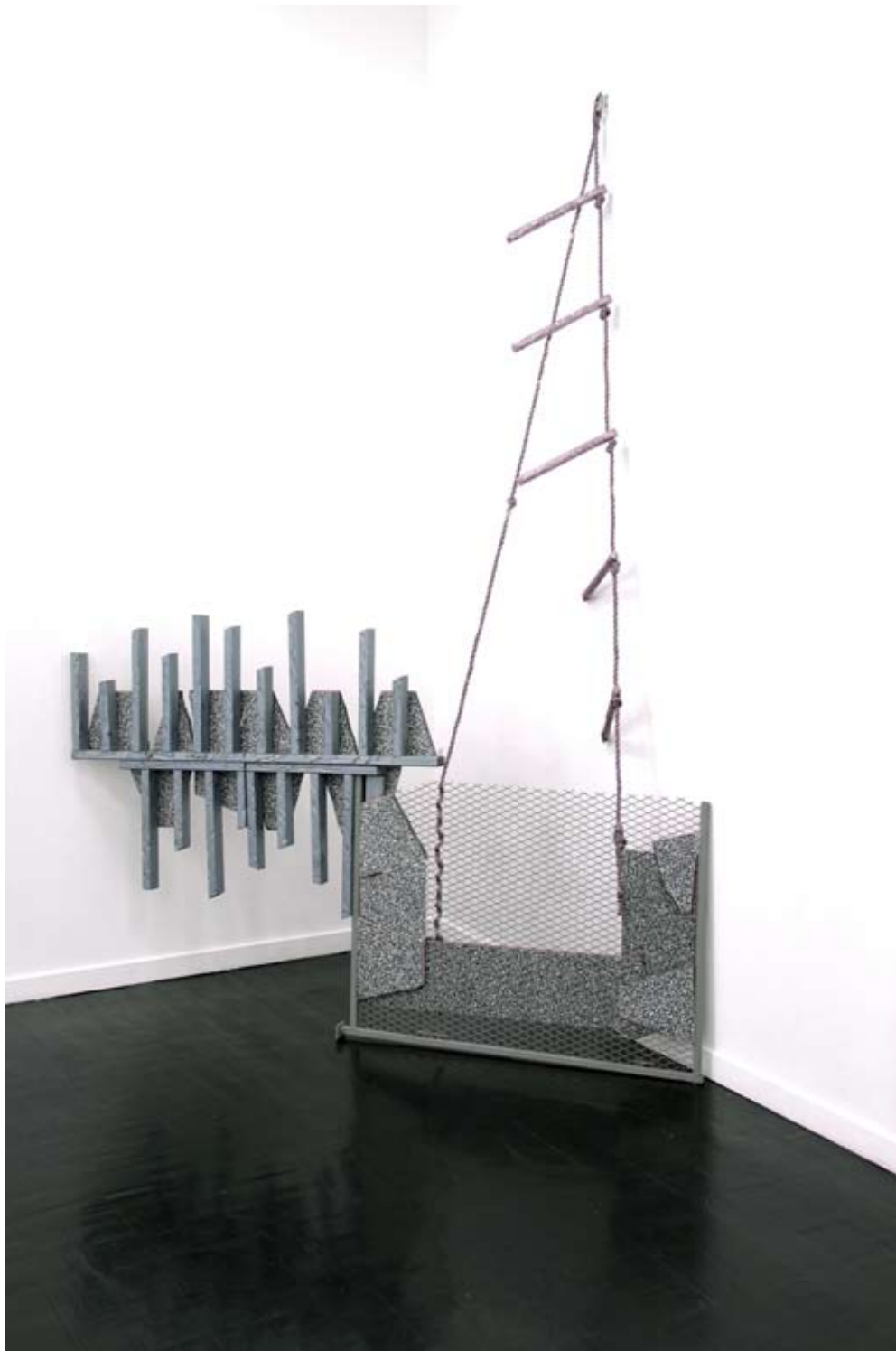
Sans titre 2012 Bois, métal, peinture, corde Installation variable